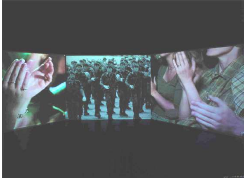
On translation – El aplauso, 1998

« On Translation: El aplauso , de 1998, forma parte de un amplio proyecto del artista, formado hasta ahora por 27 secciones, que abordan el tema de la traducción y la interpretación de unas lenguas a otras, de unos códigos a otros y la carga de inexactitud, desgaste, manipulación y mentira que se produce en este "traslado". On Translation: El aplauso consiste en una videoinstalación de tres canales: en el centro se alternan imágenes fijas de violencia, especialmente localizadas en Colombia, sin sonido, con secuencias de aplausos. En las dos pantallas laterales, secuencias continuas de sonoros aplausos. El aplauso pone en evidencia el desgaste de la información maquinalmente repetida y la saturación que produce en un espectador que se convierte en involuntario cómplice de las maquinaciones del poder mediático».