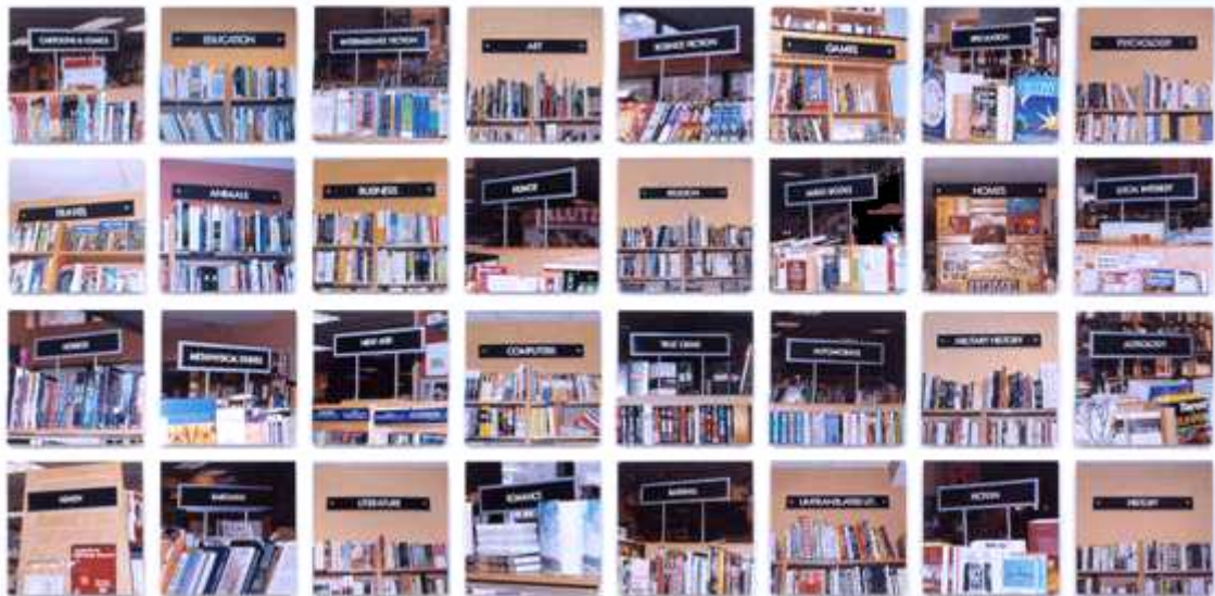
On translation - The bookstore, 2001

On translation: The bookstore es uno de los 27 proyectos que se engloban en la serie On translation que Muntadas inició en Helsinki en 1995. El tema que vertebra esta serie es el de la traducción o interpretación en distintos ámbitos, como el lingüístico, el cultural, político, etc., centrandose cada uno de los proyectos en un ámbito diferente. En On translation: The bookstore , Muntadas presenta 33 fotografías en las que se muestran las nomenclaturas utilizadas en librerías genéricas (en un primer momento en Londres y en un segundo en Nueva York) para definir las diferentes materias que se pueden encontrar. El autor muestra unos términos establecidos y aparentemente objetivos que no lo son tanto, en tanto en cuanto se establecen por el criterio subjetivo del personal que los ha organizado. Es decir, cada libro es "traducido", interpretado y definido con un solo término que en muchas ocasiones no tiene porqué abarcar el contenido.