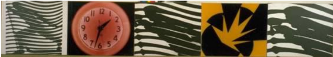
"Time" (Serie Close - Up), 1983

Time (Serie Close - Up ), 1983. Fotografía. 50,5 x 300 cm (total) 50,5 x 60 cm (c.u.).